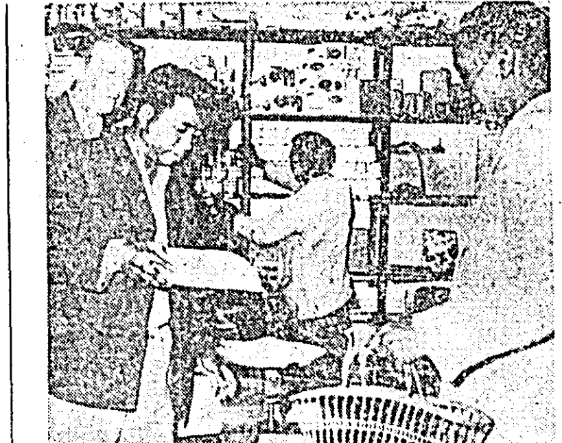
IN CLISEU: aspect din interiorul unui magazin al unei cooperative de desfacere din Republica Malgașă.

În ultimele zile, avioane cu reacție americane avîndu-și baza pe port-avioane ale Flotei a 7-a americane, în Vietnamul de sud și în Tailandă, au pătruns și mai adînc pe teritoriul R. D. Vietnam”, se spune în declarația Ministerului de Externe al R. D. Vietnam, dată publicității la 27 Iunie. Avioanele americane au bombardat și mitraliat centre populare din regiunea autonomă de nord-est și din provincia Phu Tho și au intensificat zborurile de recunoaștere în provinciile din jurul Hanoiului. Guvernul R. D. Vietnam denunță în fața opiniei publice mondiale noile acțiuni extrem de primejdioase ale SUA, protestează energetic împotriva acestora și avertizează guvernul SUA că îl revine întreaga răspundere pentru toate consecințele care decurg din noile sale acțiuni războinice.