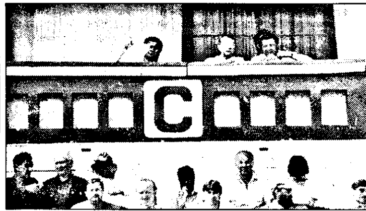
Nicicând, parcă, nu au fost atâtea locuri goale la tribuna oficială, ca la meciul F. C. UTA - Unirea Alba-Iulia.

Pro TV: ora 13,30 - Procesul etapei (rel.) ora 0,30 - Fotbal Bundesliga (rez.) Budapesta 2: ora 23,40 - Vraja sportului DSF: ora 10,00 - Fotbal european (magazin)