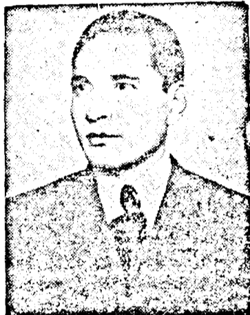
GHEORGHE APOSTOL președintele Confederației Generale a Muncii

realizarea liniei ferate Pecica-Nădlac. Cu toate greutățile întâmpinate din cauza lipsei de materiale s'a ajuns la faza ultimă a negocierii și sunt speranțe că în viitorul apropiat lucrările efective pentru construirea liniei s'au înceapă. Este demn de amintit că măsurătorile pe teren s'au și făcut.