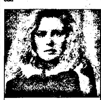
RTL - 21,15 Până-n zori vei muri - f.SUA 1992.