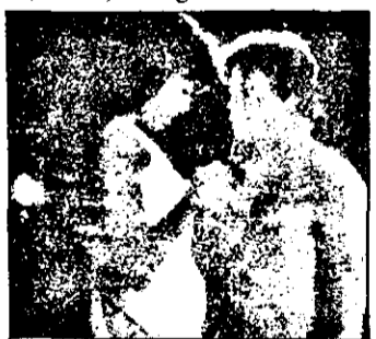
PRO 7 - 21,15 Billy The Kidd - w.SUA 1989.