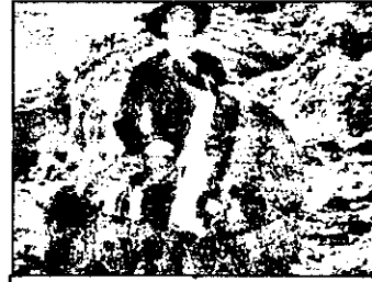
PRO 7 - 10,50 Vânătorul de recompense - w. SUA 1954

BUDAPESTA 2 11,00 Jurnal parlamentar 17,05 Afaceri, întreprinzători 17,20 Impună pentru pământ - magazin ecologic 17,40 Desene animate