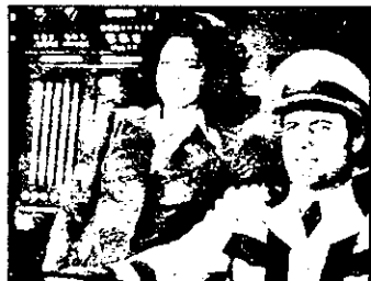
PRO 7 - 21,15 Autobuzul uriaș - comedie SUA

16,10 Teletext 16,20 Magazin Alpi-Dunăre-Adriatică 16,50 Desene animate 17,20 Victoria Occidentului - documentar istoric englez 13/4 18,10 Logopedie 18,25 Pedagogie Waldorf 18,35 Arbori simboluri 18,45 Oferte culturale 19,00 Stiri 19,10 Jurnale regionale 19,35 Kojak - serial polițist american