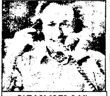
SAT.1 21,15 Zăpăciții - comedie Franța

BUDAPESTA-1 7,45 Magazinul satului 8,30 Desene animate 8,55 Mesajul Bibliei 9,05 Magazin informativ pentru tineri 9,30 Hallo, duminică! - magazin distractiv pentru toți