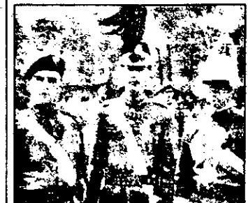
SAT 1 21,15 Cadeții de la Bunker Hill - f. acț. SUA 1981

TV 5 7,00 Coajă de banană - serial 7,30 Magazin matinal 10,00 În numele legii 11,00 Magazin pedagogic 11,30 Magazin ecologic 12,00 Panoramic european 13,05 Varietăți 14,05 Coajă de banană - reluare 14,30 Vise africane 15,30 Zoo - reluare 16,30 Întâlnirile lui Scully 17,25 Magazin medical 17,50 Bucătărie franceză 18,05 Reportaje 18,40 Arheologia 19,00 Concurs tv