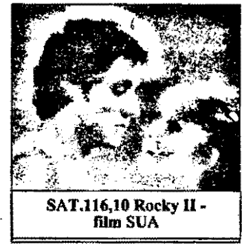
SAT.116,10 Rocky II - film SUA

7,00 Desene animate 9,00 Concurs pentru copii 9,30 Desene animate 9,55 Concurs pentru copii 10,25 Desene animate 11,00 Wonder Woman - serial fantastic american 12,00 Înapoi, în trecut - serial sf american 13,00 Căldură tropicală - serial polițist american 14,00 Concurs tv 15,40 Plan secret - film sf SUA, 1985 17,20 Don Camillo - comedie Italia, cu Terence Hill 19,45 Stiri 20,10 Doar dragostea contează 21,15 100.000 dm concurs tv 22,55 Der Spiegel tv - magazin 23,40 Prime Time - Gorbaciov la Bayreuth 0,00 Eden - serial erotic american 0,30 Play Boy 1,00 Canalul 4