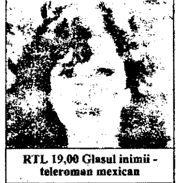
RTL 19,00 Glasul inimii - teleroman mexican

7,00 Magazin matinal 10,10 Vecinii - reluare 10,35 Trapper John M.D. - reluare 11,25 Bonanza - reluare 12,15 Concursuri tv 13,25 Tânăr și fără odihnă - serial american: „Între tată și fiu” 14,15 Trapper John M.D. - serial american: „Așa fac femeile” 15,10 Vecinii - serial austriac 15,40 Bonanza - serial western american 16,40 Star trek - serial sf american 17,45 Concursuri tv 20,00 Stiri 20,18 Sport 20,30 Roata norocului 21,15 Un bavarez pe insula Rugen - serial german 22,20 Adevărate miracole - serial 23,15 Hunter - serial polițist