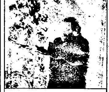
RTL 21,15 Umbra lui ninja - f. pol. SUA 1993

7,55 Reluări seriale 9,55 Inimi păcătoase - film SUA, 1986 cu Diane Keaton și Jessica Lange 11,55 Reluări seriale 12,55 Piele crudă - serial western american 14,00 Ziua răzbunării - comedie Anglia, 1961 15,55 Addeley - serial american: „Furt de cai” 16,50 Mr. Belvedere - serial american: „Gigolo” 17,20 Fermecătoarea Jeannie - serial american: „Abdulah” 17,50 Trick 7 - desene animate 19,25 Caré de asi - serial american: „Serenada lui Romeo” 19,55 Liniștita noastră casută - serial american: „Cina” 20,25 Roseanne - serial american 21,00 Stiri