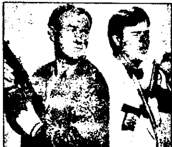
PRO 7 - 21,15 Un glonte pe țevă - comedie SUA 1989

9,40 Marinarii de pe Volga - film Franța-Italia - reluare 11,25 Autobuzul uriaș - comedie SUA - reluare 13,05 M.A.S.H. - serial distractiv american - ultimul episod 13,35 Air Force - serial de acțiune american 14,35 Kung Fu - serial american 15,35 Cazurile Profesorului Chase - serial de acțiune american - ultimul episod 16,35 Aventură în Malaisia - serial de acțiune SUA - primul episod