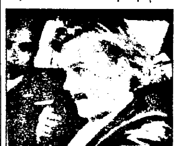
PRO 7 - 23,10 Renegații - f.pol.SUA 1989

9,00 Jurnal candian 9,35 Bibi și prietenii - serial francez 10,30 Magazin economic 11,00 Clubul întreprinzătorilor 11,20 Magazin economic 12,15 Scopul: Europe - magazin informativ din țările CE 12,40 Politică internă belgiană 13,05 Magazinul alpinistilor 13,40 Jurnal elvețian 14,05 Magazin economic 14,30 Orizont '93 15,00 Imagini din țările în curs de dezvoltare 16,00 Magazin literar 16,45 Correspondențe 17,00 Jurnal TV 5 17,10 Curs de franceză 17,35 Concurs TV 18,00 Magazinul tipicilor 18,30 Emisiune nouă: chipuri postale