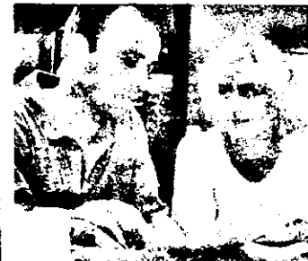
SAT 1 - 0,10 Doamna nopții - erotic Italia

10,40 Trapper John M.D. - reluare 11,25 Bonanza - reluare 12,45 Roata norocului - concurs tv 13,25 Tânăr și fără odihnă - serial american distractiv 14,15 Trapper John M.D. - serial cu medici americani 15,10 vecinii - serial austriacian 15,40 Bonanza - serial western 16,40 Star Trek - serial sf american 17,45 Concursuri tv