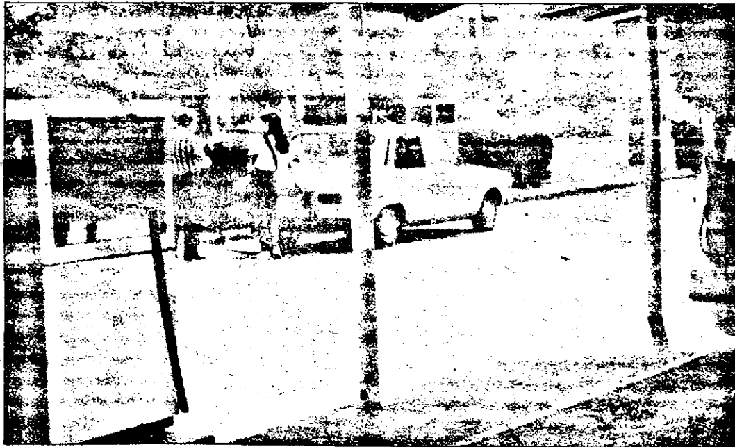
Au dispărut cozile la benzină. Oare să-i fi speriat pe automobilisti prețul benzinei, sau s-a înăspriț controalele la frontiere?

După o perioadă de înșeninare, există, din păcate, unele semne că relațiile româno-ungare reintră într-o perioadă de reflux.