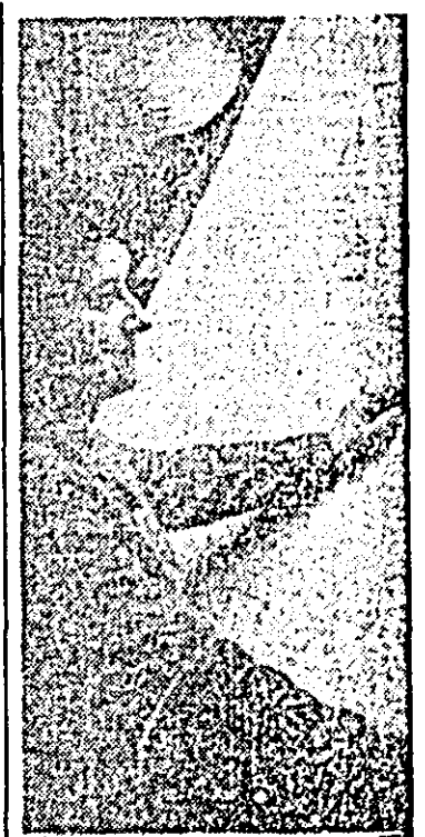
În Întreprinderea textile, C.T.C.-Ista Dolna Mercea se evidențiază prin grija deosebită pe care o acordă calității țesăturilor.

că, la data de 15 decembrie, a fost realizată integral și sarcina anuală de plan la export — urmare a onorării în cele mai bune condiții a contractelor încheiate cu beneficiarii de peste hotare, creșterii gradului de adaptabilitate a producției la cerințele partenerilor de peste hotare. În privința exportului, se evidențiază în principal, pentru realizările obținute, colectivul de muncă de la IJPIPS.