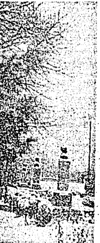
Pelsaj de iarnă.