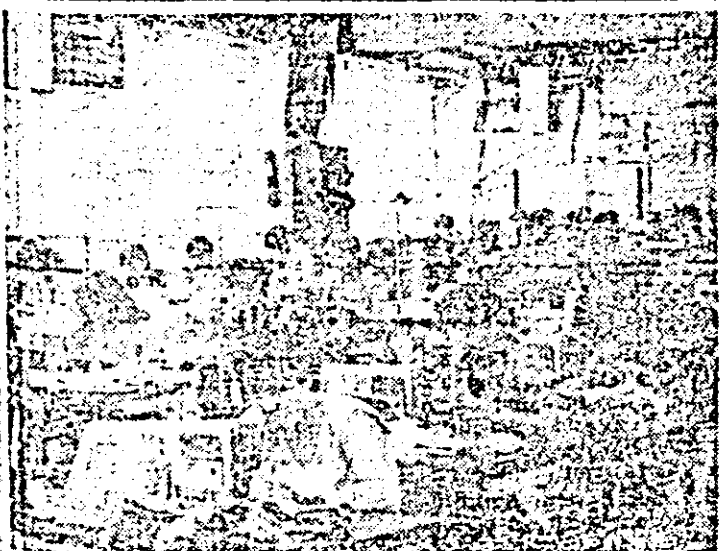
Aspect de muncă în atelierul confecției al întreprinderii „Arădeanca”.