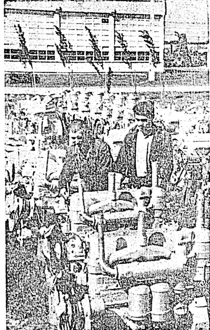
Un nou lot de motoare reparate este gata să ia drumul beneficiarilor. Este o contribuție însemnată pe care colectivul Uzinei de reparații o aduce la mecanizarea lucrărilor din agricultură.