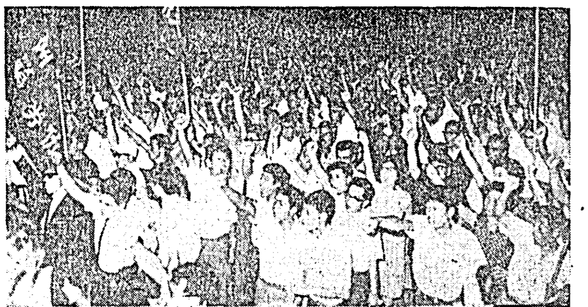
JAPONIA. Recent, un alt submarin atomic american a sosit într-un port japonez. La Yokosuka s-au succedat zi de zi demonstrații și marșuri de protest...