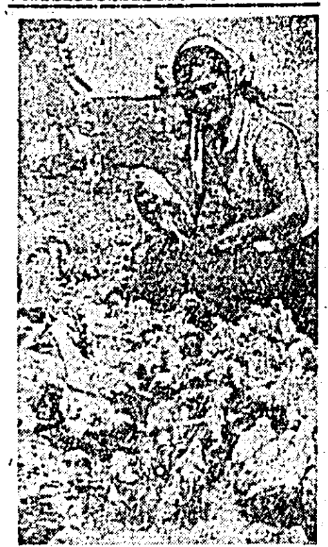
La GAS Aradul Nou: îngrijitor de păsări.

Această secție execută reparații de ceasuri, rame pentru ochelari etc.