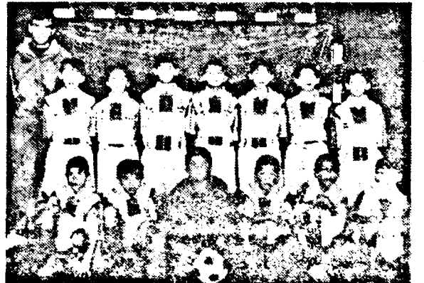
Ei sunt cei care au calificat Romvestul la faza zonală a Memorialului Gheorghe Ola.

vărat în aer liber pe jumătate de teren, dar, dacă ne facem jocul obișnuit bazat pe o posesie prelungită a