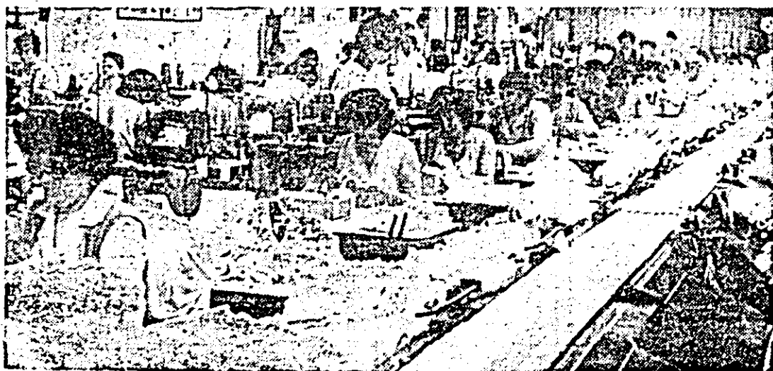
Aspect de muncă în secția confecției a Întreprinderii „Tricoul roșu” Arad.