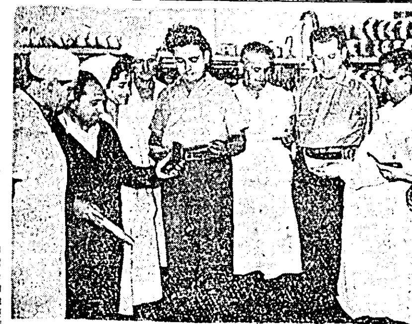
Actiuni de folos obștesc

Tinerii din satul Aluniș participă cu multă însușire la diferite acțiuni de muncă patriotică, contribuind astfel la înfrumusețarea satului nostru și la terminarea lucrărilor agricole. Tinerii din brigada de muncă patriotică au strîns și legat snopi pe o suprafață de 5 ha grâu, și au participat și la alte acțiuni de folos obștesc.