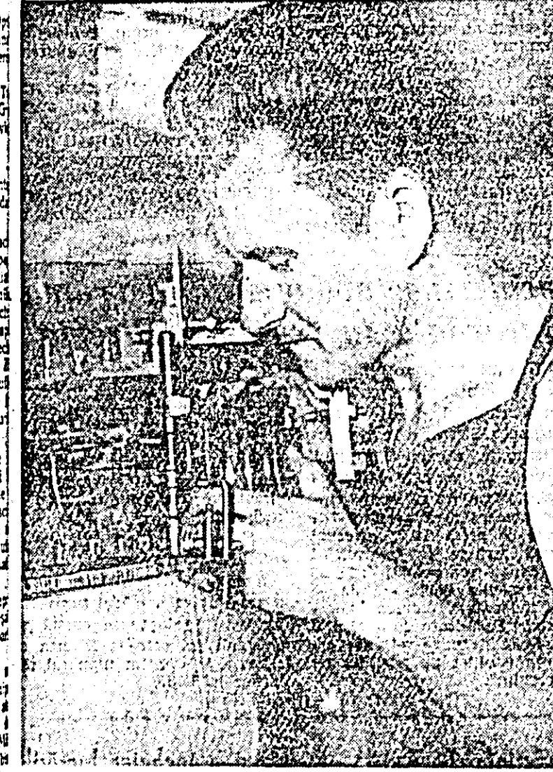
... în fabrica „Tricoul roșu” este cunoscut ca unul dintre conducere brigada UTM nr. 4. Împreună cu membrii ei, în luna Iunie a depășit planul de calitate cu 9 procente, a produs 1014 kilograme de tricou peste sarcinile planificate și a economisit 24.550 ace.

In fabrica „Tricoul roșu” este cunoscut ca unul dintre conducere brigada UTM nr. 4. Împreună cu membrii ei, în luna Iunie a depășit planul de calitate cu 9 procente, a produs 1014 kilograme de tricou peste sarcinile planificate și a economisit 24.550 ace.