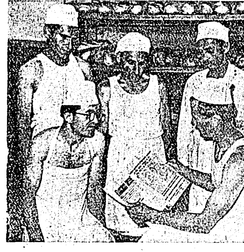
Scrisoarea C. C. al P.M.R. adresată participanților la concursul pe țară „Pentru pîinea de cea mai bună calitate” și către toți muncitorii, tehnicienii, inginerii și funcționarii din industria de panificație și morărit a fost primită cu un deosebit interes de către colectivul de muncă al întreprinderii de panificație din orașul nostru. Ziarele în care se publică aceste documente au început să treacă din mîna în mîna, lectura lor fiind urmată de însușirile discutiilor.

Cu cîteva zile în urmă la fabrica „Fierarul” au început trei cursuri de calificare, de 6 luni, organizate pe profesii, pentru asistentații și controlorii de calitate. Deschiderea cursurilor a fost primită cu multă bucurie la primele trei lecții frecvența fiind de 95 la sută.