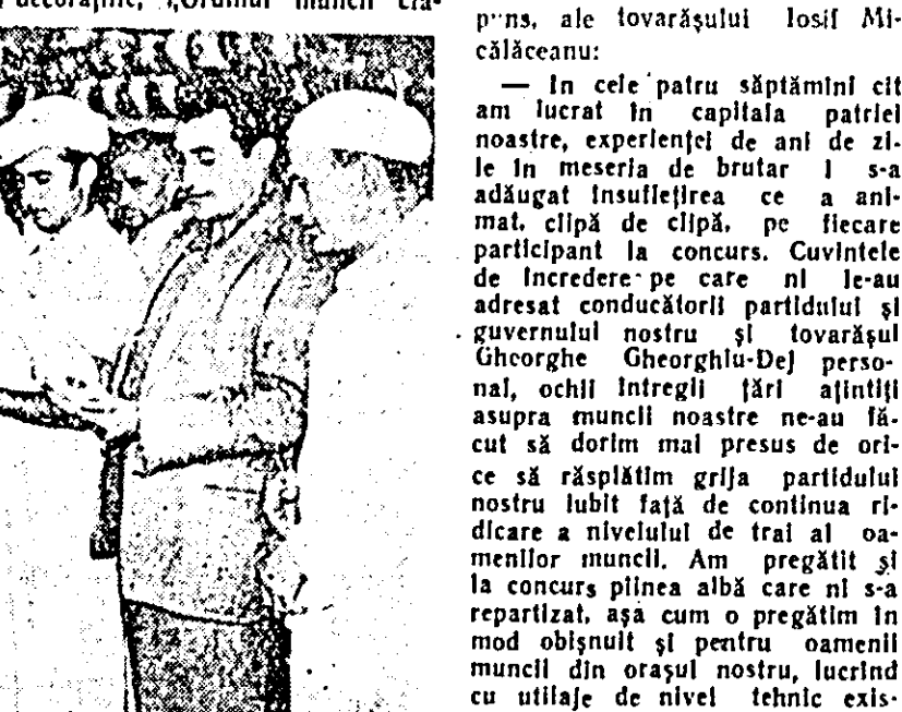
Cît e de plăcut să te întorci în mijlocul tovarășilor de muncă decorat și premiat. În clișeu: cîștigătorii concursului în mijlocul tovarășilor lor.