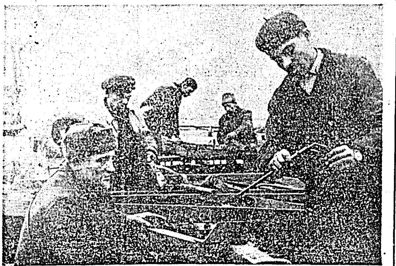
La gospodăria de stat din Zimandul Nou se lucrează din plin la repararea utilajului agricol