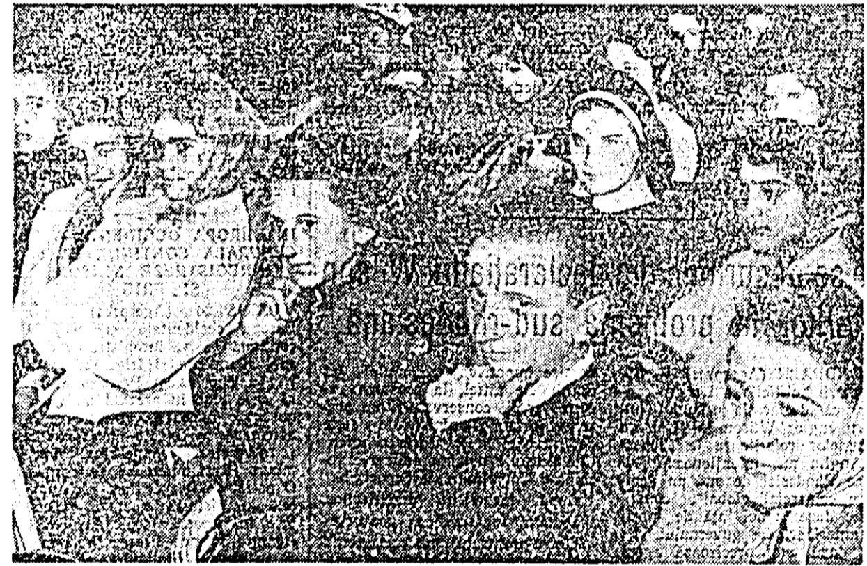
Sînt atîtea profesioniști... Și toate sînt frumoase și folositoare a oamenilor. Pe care să mi-o aleg?

Răsună în frumoasa sală a palatului cultural voci calde a-păntate ca și tinerețea celor care le rostesc, vorbind despre frumusețea acestor ani, anii împlinirii, ani ce li poartă tot mai sus spre cetatea științei. Sînt anii cînd își descoperă vocația, cînd se aleg și se hotărăsc profesioniști. Vorbesc cu convingere despre frumusețea și utilitatea fiecărei meserii, despre