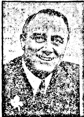
FRANKLIN D. ROOSEVELT.

Washingtonból jelentik: Az elektorválasztások az USA minden államában a legnagyobb rendben folytak le, annak dacára, hogy a munkanélküliség kérdése és a szesztilalom megszüntetése voltak azok a tétek, amelyekért a demokrata Roosevelttel és a republikánus Hoover a mai napon megmérkőztek. Roosevelttel győzelme már tegnap előrelátható volt és az egyre érkező jelentések szerint a demokraták elnökjelöltje minden vonalon fölényes többséggel vezetett, Alabama, Florida, Georgia, Oklahoma, Texas, Missouri, Maryland, Délkarolina és Nebraska államokban szép eredményeket értek el a demokraták, de főként Pennsylvania, Kansas és Colorado államokban szerzett eredményeik-