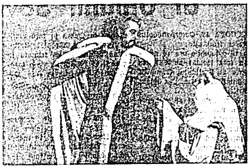
IN CLIȘEU: O scenă din cîntul V. al dramei istorice „Răzvan și Vidra”.

Teatrul de stat din Arad și-a deschis, zilele trecute, în mod oficial, stagiunea 1961-1962, prezentând în premieră drama istorică „Răzvan și Vidra” de Bogdan Petriceicu Hașdeu.