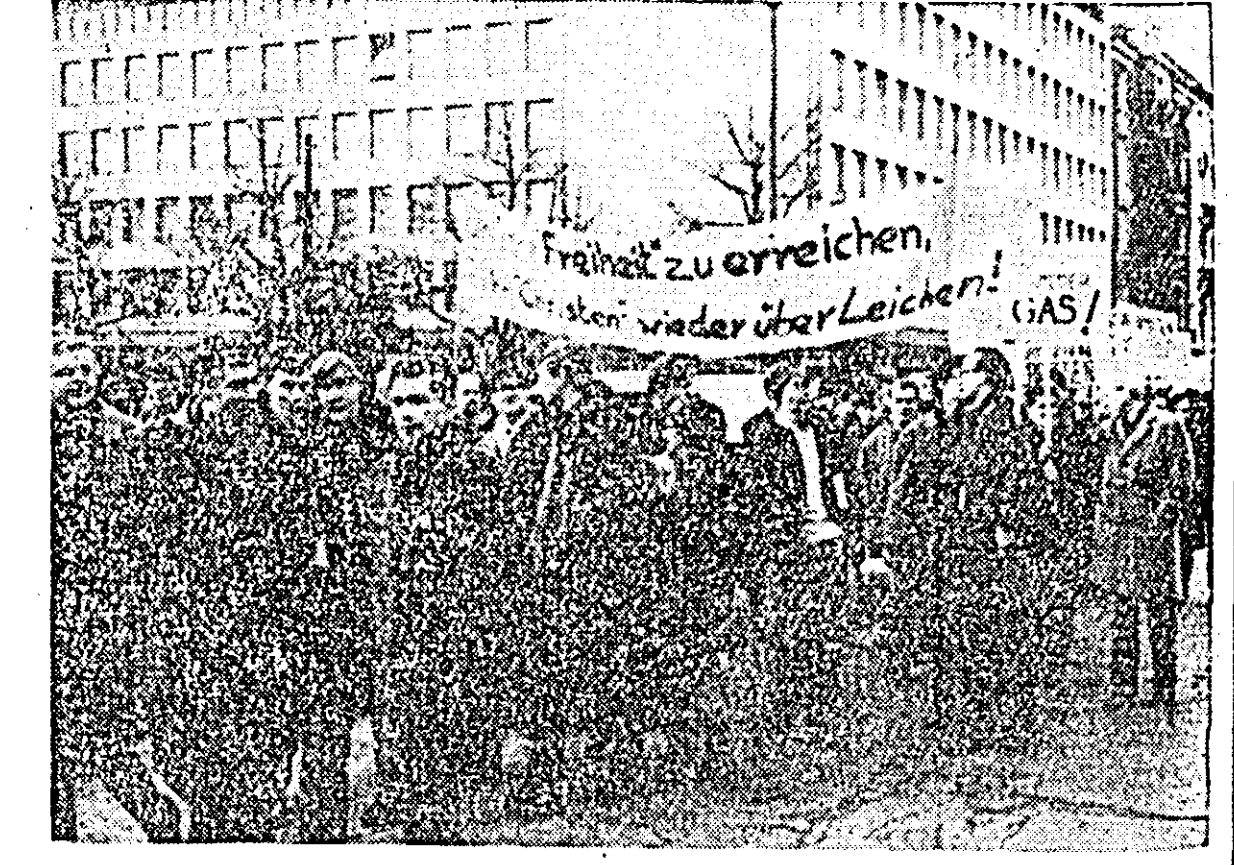
Recent, peste 1.500 de studenți din Berlinul occidental au organizat o demonstrație de protest împotriva politicii SUA în Vietnam.

SAIGON 19 (Agerpres). — În noaptea de vineri spre sîmbătă, informează agenția UPI, elemente ale partizanilor sud-vietnamezi au atacat prin surprindere un post de poliție situat într-o suburbie a Saigonului. Un purtător de cuvînt al organelor politicești a declarat că atacul s-a produs într-o zonă unde se află mari depozite militare americane. Lupta aneagălată între cele două părți a durat cu intermitență pînă sîmbătă dimineața, cînd patrioții sud-vietnamezi s-au retras. Agenția citată nu menționează pierderile suferite de postul polițienesc. Într-un comentariu al agenției France Presse se relatează că în operațiunile militare de mare anvergură organizate de comandamentul SUA au fost folosite din plin gaze toxice. Prin pulverizarea acestora pe sol s-a urmărit depistarea tunelurilor și ascunzătorilor construite de trupele patriotice. În aceleași operațiuni, armata terestră a cooperat strîns cu aviația. Aparatele americane, scrie AFP, au efectuat zilnic 500 de misiuni de luptă.