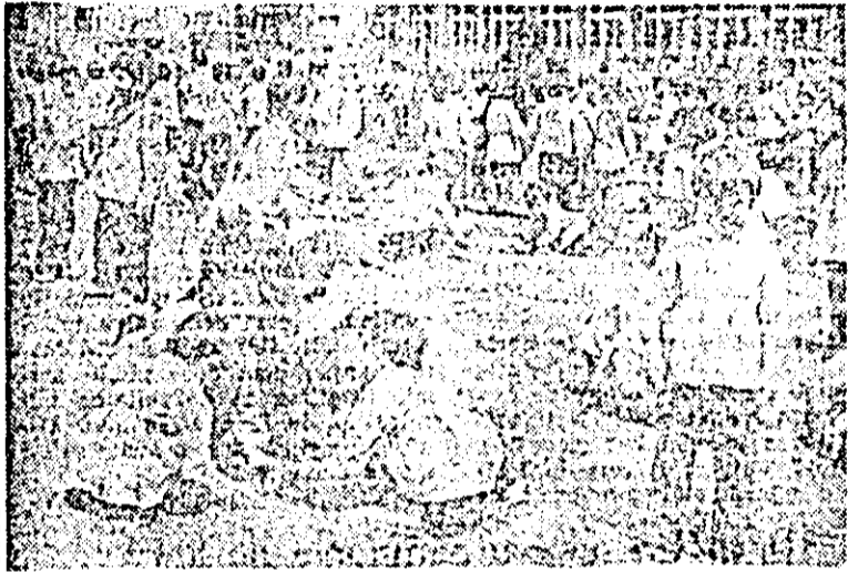
Moment de la grădinița nr.17 din zona Aurel Vlaicu a municipiului.