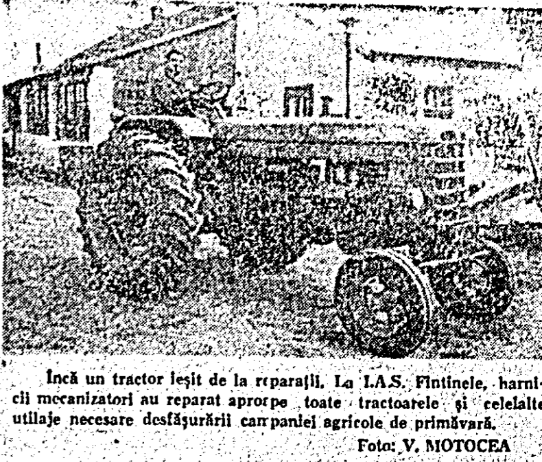
Încă un tractor leșit de la reparații. La I.A.S. Flîntinele, harnicii mecanizatori au reparat aproape toate tractoarele și celelalte utilaje necesare desfășurării campaniei agricole de primăvară.

L. POPA C. IONUȚAS ȘT. IACOB C. SIMION A. HARȘANI (Cont. în pag. a III-a)