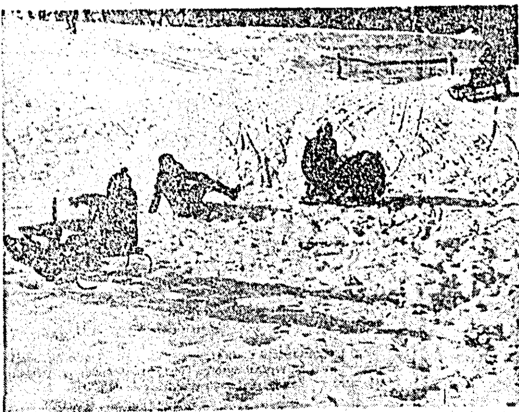
Hal copil la derdeluș...