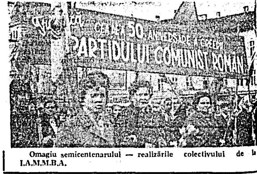
Omagiu semicentenerului — realizările colectivului de la I.A.M.M.B.A.

Aducînd cu ei ceva din noblețea frumoaselor profesii de medic, farmacist, asistent și soră medicală, infirmieră etc. prin fața tribunei oficiale trec acum cadrele ce muncesc în sectorul sanitar al municipiului și județului nostru. Zîmbetele ce-au înflorit pe chipurile și-n privirile lor sînt o expresie fidelă a satisfacției pentru frumoasele realizări pe care le-au obținut pe tărîmul continui îmbunătățiri a asistenței medicale, realizări pe care acești „oameni pentru oameni” le-nclină cu bucurie și căldură măreței aniversări a semicentenerului Partidului Comunist Român.