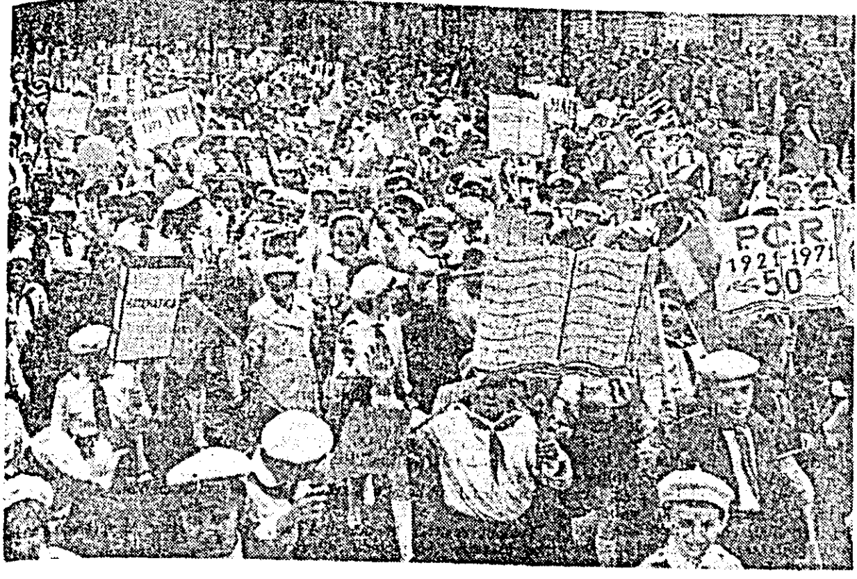
Tineretea patriei în marş spre viitor.