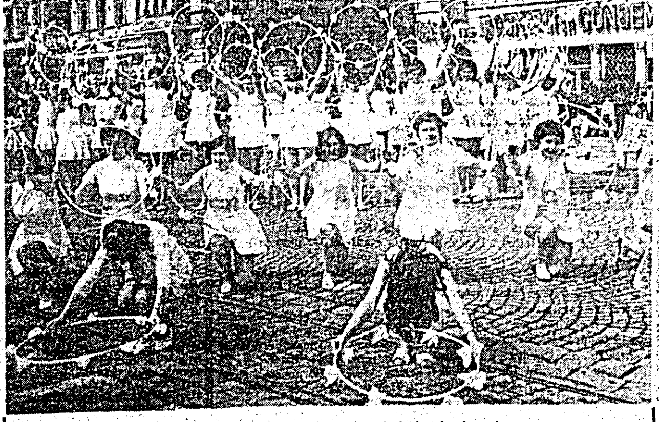
O repriză de gimnastică — un adevărat evantai al vîrstelor fragede.

Coloana de demonstrații de la Combinatul alimentar nici nu trecuse încă de tribune cînd izbucni explozia de culori, chiuituri, melodii a formațiilor de dansuri reunite care intră tumultuos. În pas tinerec, ritmat, în piață. Sint acțiștii amatori, iubitori ai folclorului, cărula îi consacra timpul de după muncă, de la Uzinele de vagoane, participanți și premiați la multe festivaluri și concursuri naționale, de la CFR, UTA. Uzina de strunguri ș.a. Hora care se desfășoară în fața tribunelor, exprimă bucuria de a trăi. Fericirea de a vedea vie realizarea năzuințelor de veacuri, de a trăi într-o patrie liberă, înfloritoare. Mîna în mîna, tineri muncitori români, maghiari, germani, alcătuesc cunună vie, ea ghîrlanță de primăvară: simbolul înfrățirii.