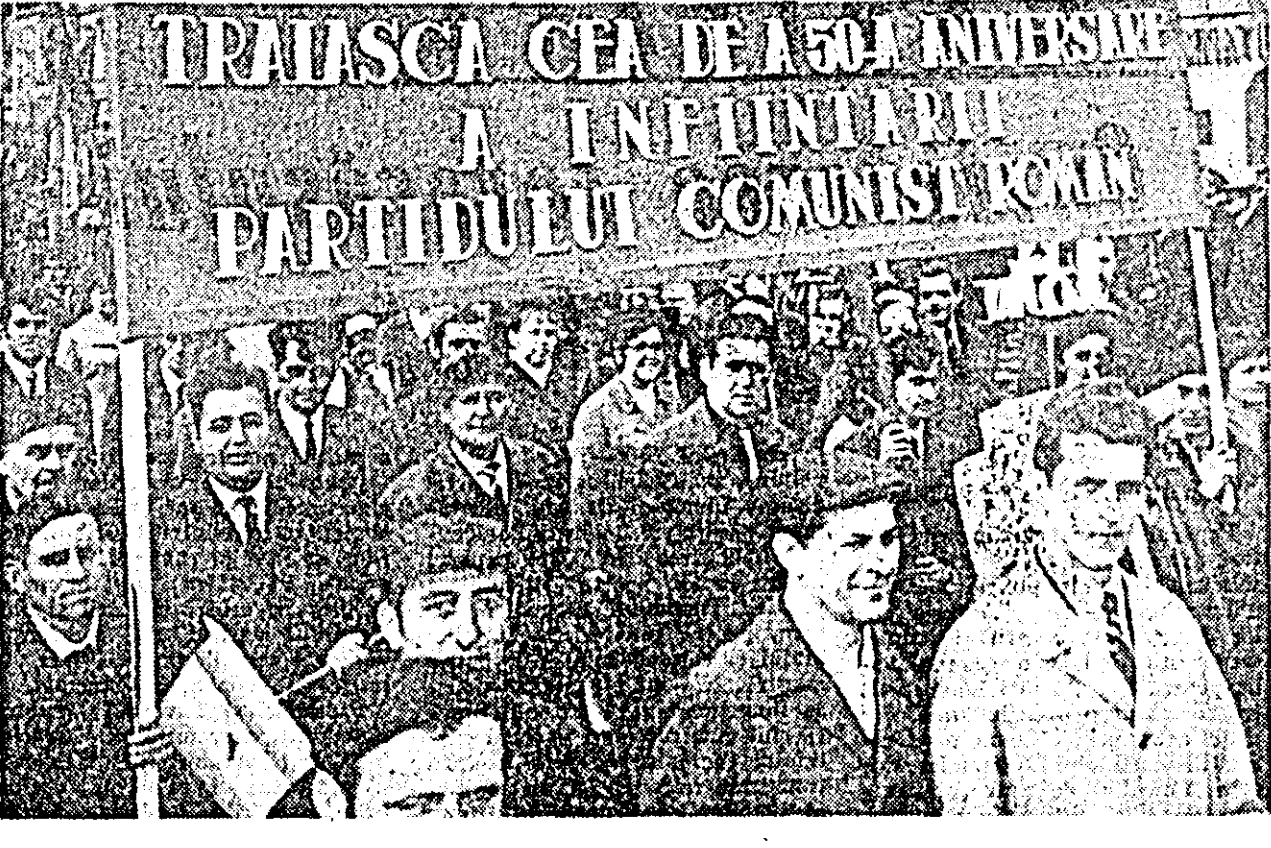
Raportînd succese deosebite, trece coloana muncitorilor de la Uzina de strunguri.

Insuși soarele, ascuns pînă atunci după năframa plumburie a cerului, s-a decis să apară, să ridă și să alinte mulțimea de copii și flori pe