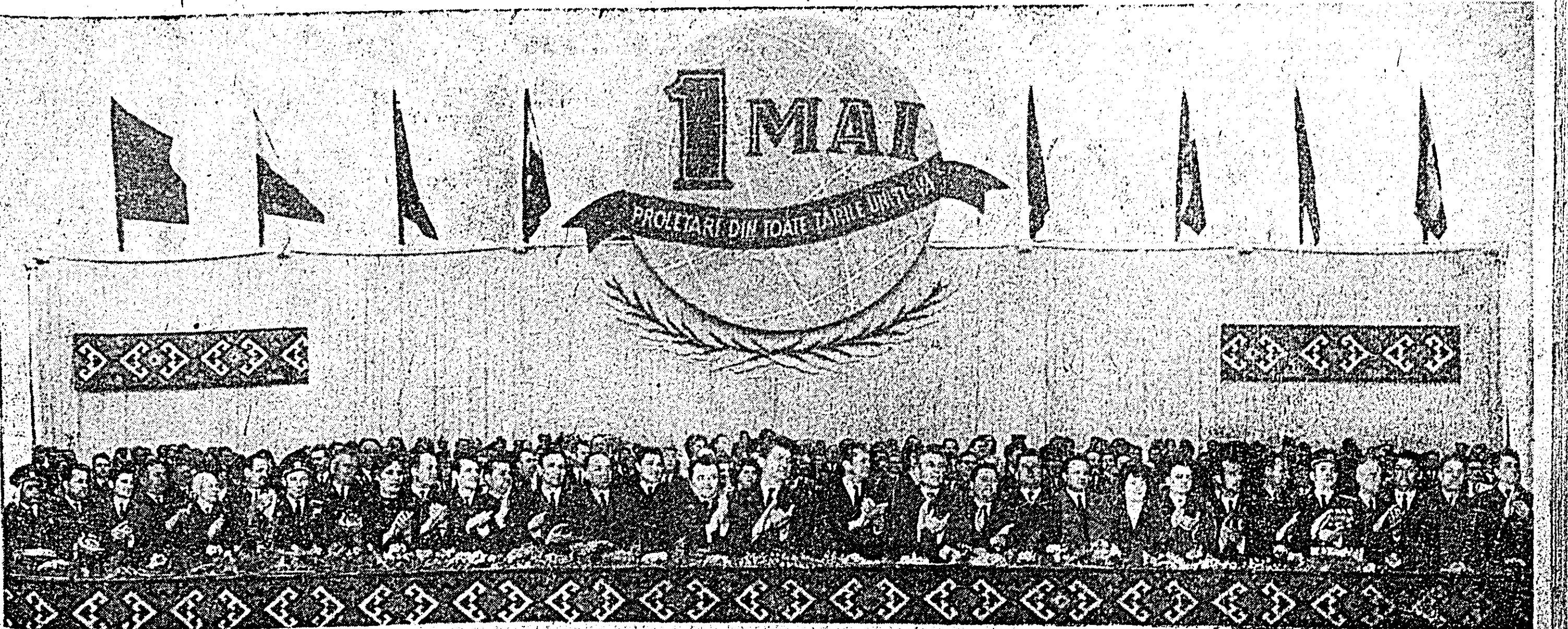
Tribuna oficială în timpul demonstrației oamenilor muncii din Arad