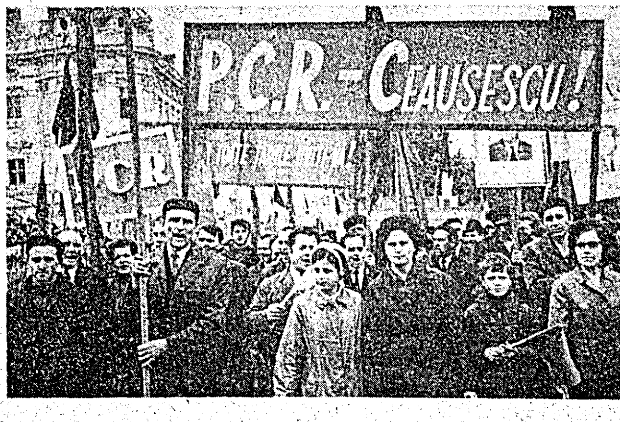
Șuvotul viu al demonstrației oamenilor muncii a fost deschis de constructorii de vagoane.