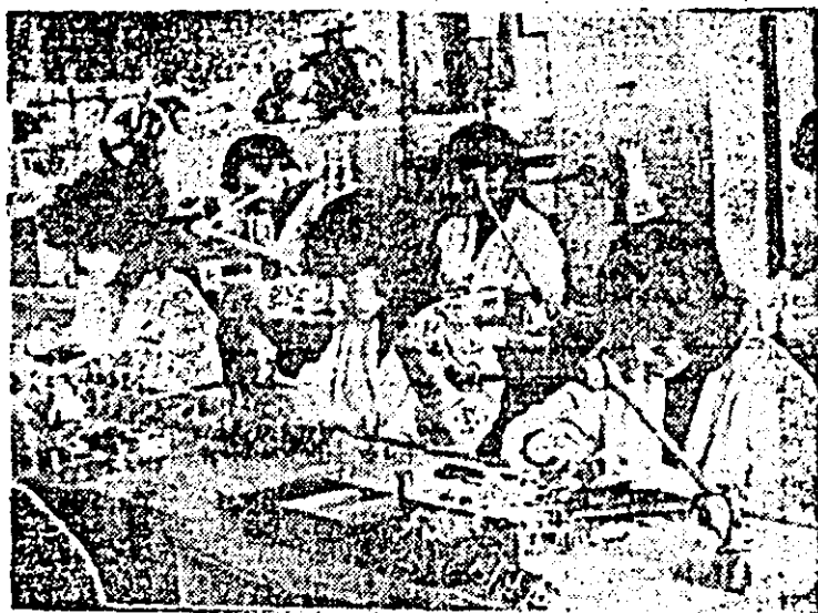
Aspect de muncă în atelierul montaj al întreprinderii de orologerie industrială.