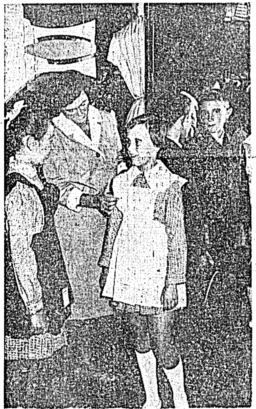
Apropierea noului an școlar se face din plin simțită și în magazinele de confecții, unde se solicită tot mai multe uniforme școlare.

Timpe de două zile, cadrele didactice vor dezbate probleme pe tema „Sporirea eficienței lecției, mijloc principal de ridicare a nivelului activității instructiv-educative în școala de cultură generală” precum și prevederile noului regulament de funcționare a școlilor de cultură generală. De asemenea, în cadrul constăturii, vor stabili măsuri menite să ducă la îmbunătățirea continuă a muncii educative în școli și la ridicarea nivelului de pregătire al elevilor în noul an școlar. (Agerpres)