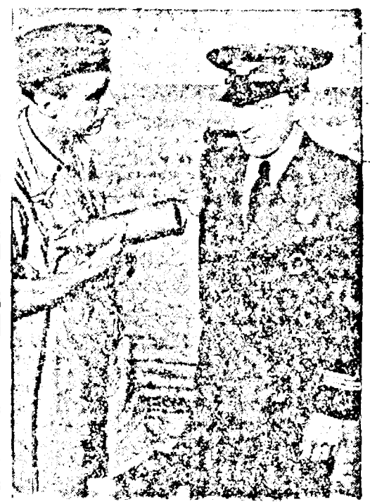
După a 16-a victorie aeriană a sa, un căpitan aviator român, este felicitat de camaradul său german.

la prețurile de vânzare ale industriașilor declarate pe listele nestampilate în conformitate cu dispozițiunile deciziunilor Nr. 431 și 440/941, atât pentru țesăturile standardizate cât și pentru cele nestandardizate. Comercianții cu ridicata și cei cu amănuntul vor adăga taxele proporționale mai sus arătate, la prețurile țesăturilor standardizate și nestandardizate deținute în stoc la 21 Septembrie 1941 și declarate pe listele de prețuri stampilate. Industriașii respective vor înscrie pe facturile eliberate comercianților menționate că taxele proporționale mai sus arătate au fost incluse în prețurile de vânzare. Industriașii și comercianții nu vor putea pune în vânzare produse și mărfuri înainte de a fi obținut stampilarea listelor prețurilor respective. Stampilarea se va cere în termen de cinci zile dela intrarea mărfurilor în depozitele fabricelor sau în magazii-tele comercianților.