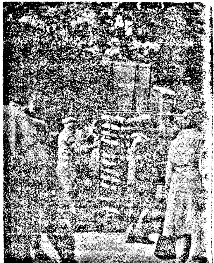
Pinea noastră cea de toate zilele...