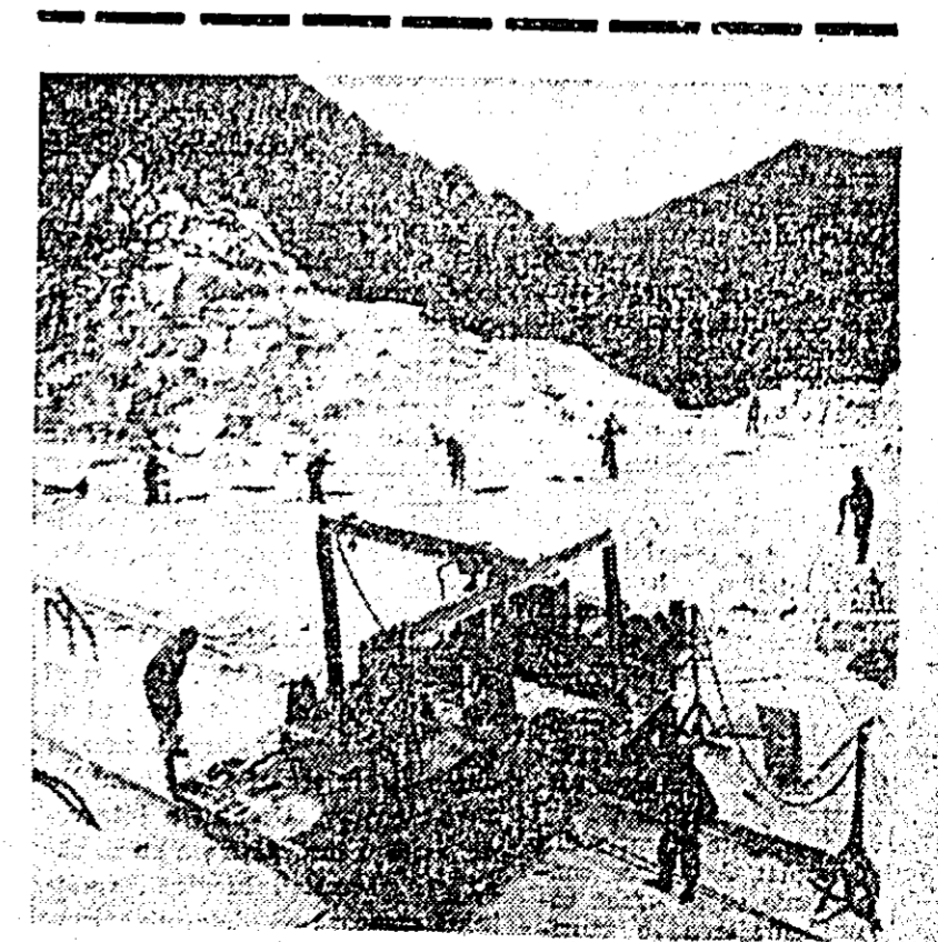
Cariera de marmură din Ruschița este cea mai mare carieră de marmură albă din Europa. În CLISEU: Aspect din cariera de marmură Ruschița.

Toți cei care au luat cuvîntul la această adunare au subliniat că, deși sporite, mai complexe sarcinile anului 1968 sînt pe măsura forțelor și rezervelor de care dispune întreprinderea, pot fi deci realizate cu succes. Bazat pe asemenea rezerve și posibilități colective întreprinderii s-a angajat să-și depășească planul producției globale și marfă cu 1.000.000 lei, productivitatea muncii cu 1 la sută, să realizeze beneficii și economii suplimentare la prețul de cost (cu cîte 150.000 lei) etc. Temeiul acestor angajamente este hotărârea, exprimată și cu acest prilej, de a face și din 1968 un an bogat în realizări.