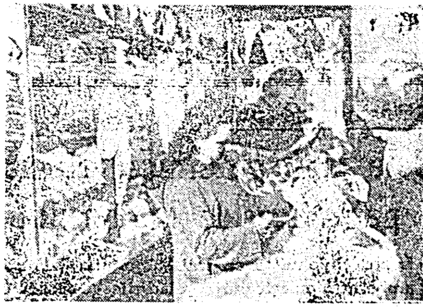
Unitatea „Bebeluş” din Piața Avram Iancu oferă pentru cei mai mici un larg sortiment de produse.