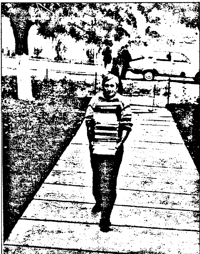
Școala generală Seleuș : Domnul director muncește și cu ... brațele.

Rândurile de față se vor o constatare a modului cum oamenii școlii întâmpină deschiderea noului an școlar.