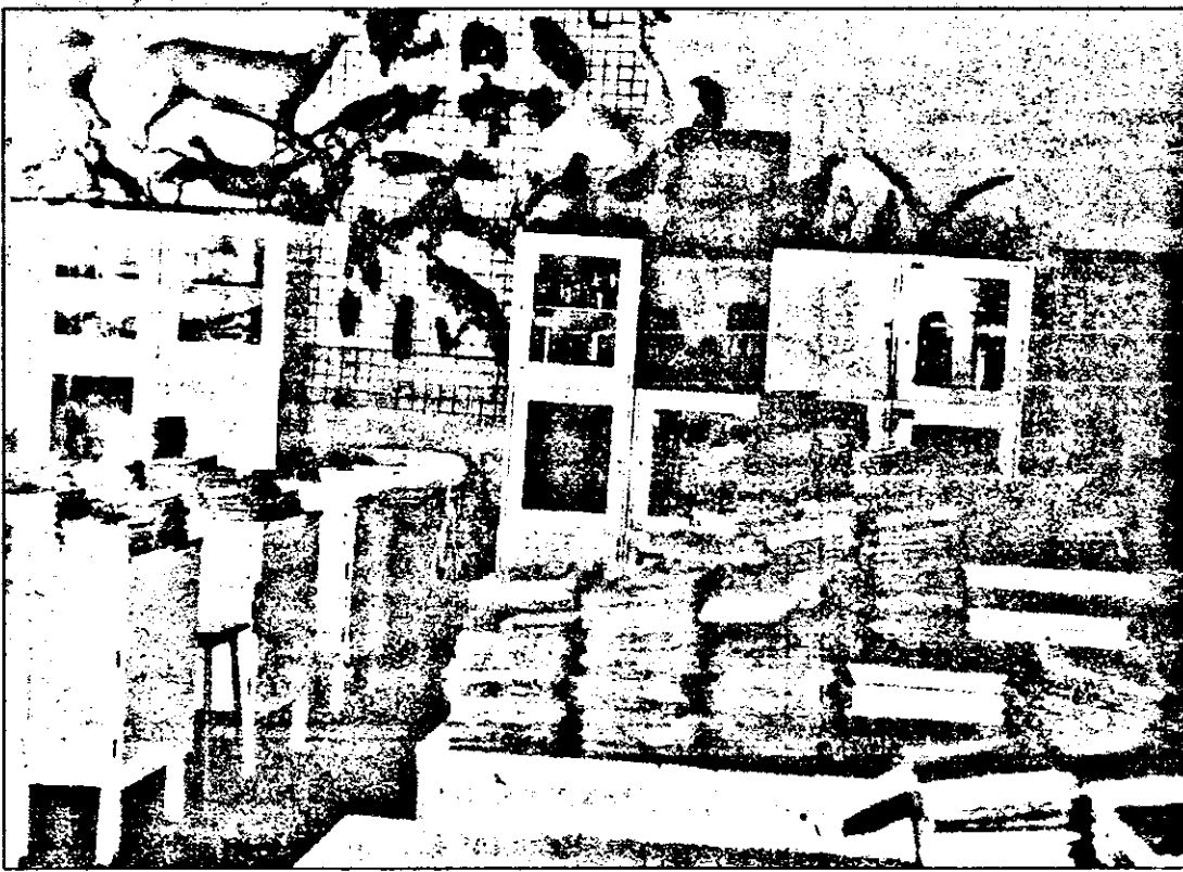
Școala generală Ineu : Laboratorul de biologie și manualele care își așteaptă elevii.