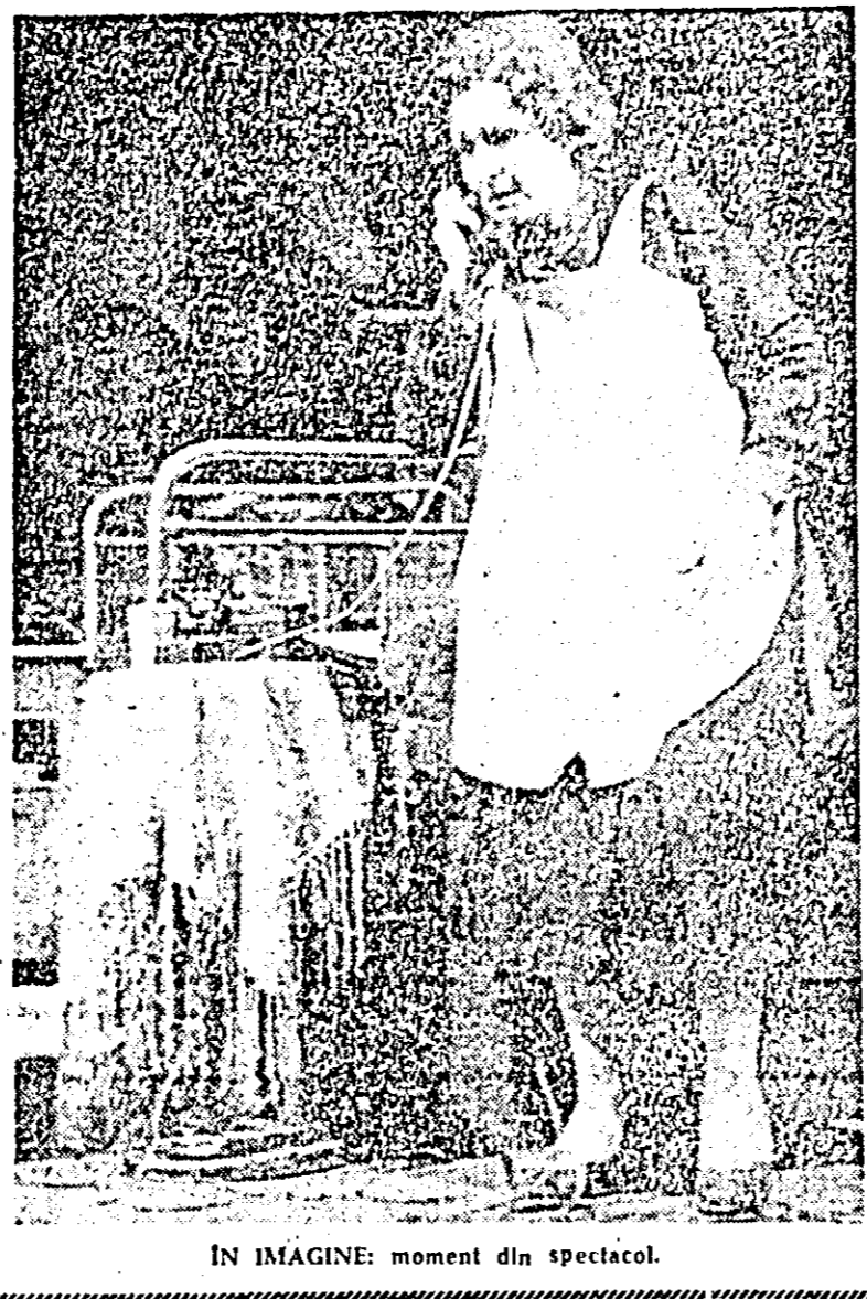
ÎN IMAGINE: moment din spectacol.