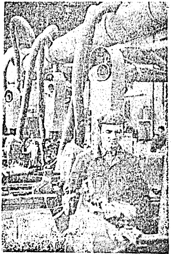
Dolarea tehnică a fabricii „Liberitatea” asigură muncitorilor condiții de lucru dintr-unele cele mai bune. Iată în imagine un aspect din sala mașinilor de copiat calapoade, săli înzestrată cu utilaje automatizate de mare productivitate.