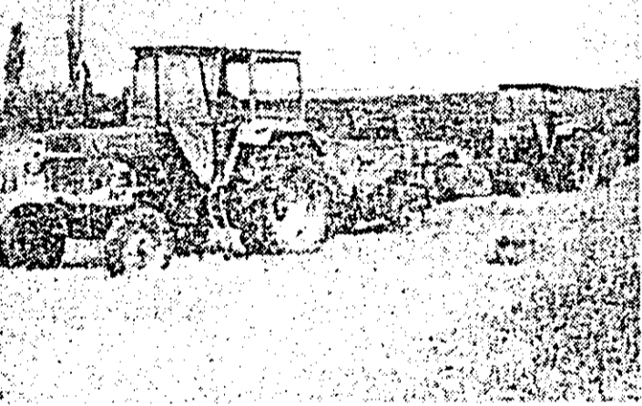
C.U.A.S.C. Sinleani. Operativ, după recoltarea orzului, presele de balotat string palele, eliberând terenul.

În afară de orz s-a mai recoltat și rapita de ulei de pe mai mult de jumătate din suprafața cultivată. Nu putem spune însă același lucru din