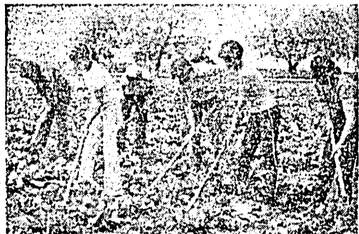
Elevii Școlii generale nr. 1 din Curtici își aduc și ei contribuția la buna desfășurare a lucrărilor de întreținere a culturilor. Iată-l, în orele de practică, lucrînd pe terenurile cooperativei agricole „Lumea nouă” din localitate.

Exemplul produsul nr. 6 denotă elocvent faptul că sinteza dintre înțelegerea clară a îndatoririlor ce revin în contextul realizării exemplare a sarcinilor la export și acțiunea hotărîtă în direcția îndeplinirii acestor sarcini constituie fundamentul pe care se întemeiază, pe piața externă, prestigiul unei întreprinderi. Marii majorități a colectivului muncitoresc de aici îi este cît se poate de clar faptul că menținerea pe o piață externă, în condițiile actuale conjuncturii economice mondiale, înseamnă competitivitatea produselor, ritmicitate în livrări — adică multă muncă, definită de coordonatele calității și eficienței.