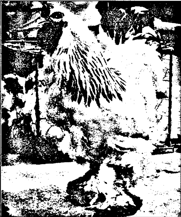
Trufașul cocoș galle - simbol al broscărilor - este pe cale să năpârlească. Sigur că-și vor alege ca simbol broscă franceză. Din patriotizm!