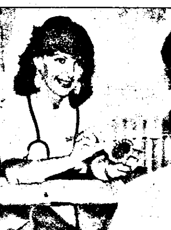
pentru tratamentul unor afecțiuni...

Este indicată pentru: femei tinere, sănătoase; nefumătoare; care optează pentru o metodă cu eficiență contraceptivă crescută; cu o viață sexuală stabilă; femei care nu au copii sau mai doresc copii în viitor (nu și-au încheiat planificarea familială);