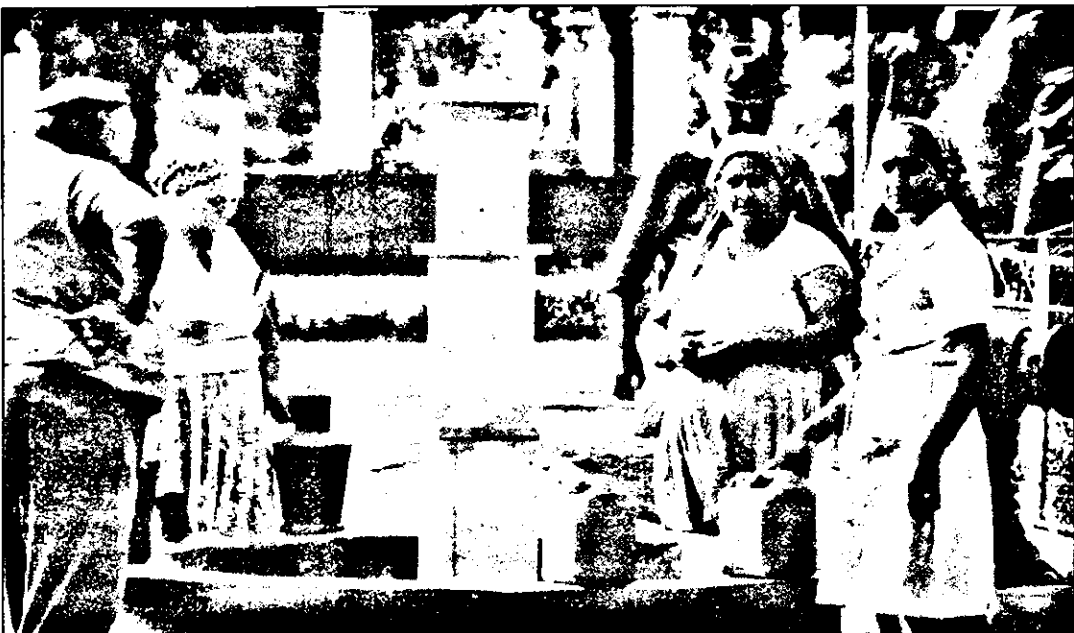
La Șepreș, fântânile stradale sunt și puține și cu debit mic, ceea ce face ca în aceste zile caniculare apa să fie la mare preț.