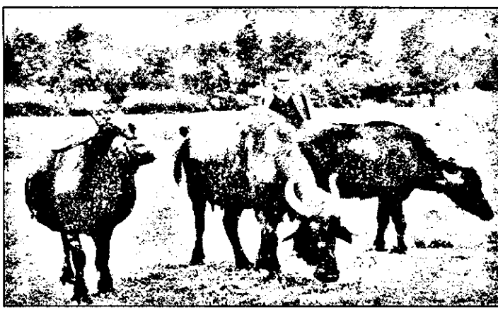
În zona Vărfurle-Hălmațiu, tradiția creșterii bivolorilor se mai păstrează și astăzi.