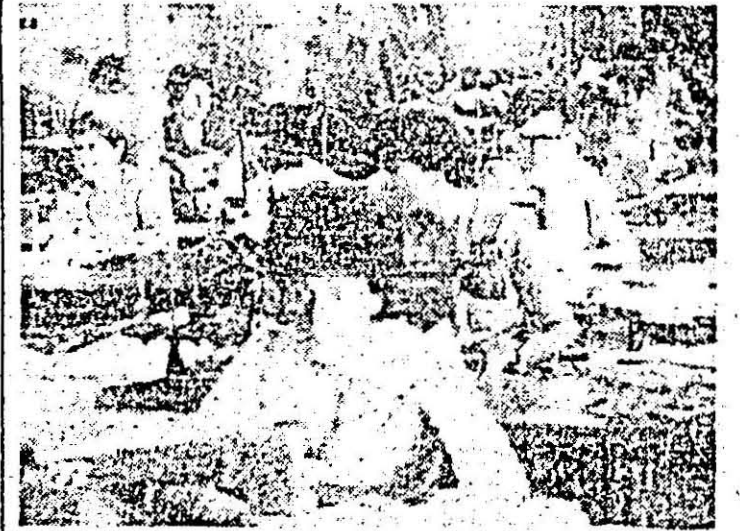
Aspect de muncă în atelierul confecției din cadrul C.P.A.D.M. Pecica.

(Urmare din pag. 1) Am mai remarcat și faptul că, odată cu arăturile, se încorporează în sol cantități însemnate de îngrășăminte organice la cooperativele agricole „Podgoria” Sîria, Sîmbăteni, Păuliș, Mîșca, Covășin și Măderat, suprafața fertilizată astfel ridicîndu-se la 366 hectare, dar lucrarea continuă în vederea asigurării unor producții sporite în anul viitor la principalele culturi de sfeclă de zahăr, porumb și altele.