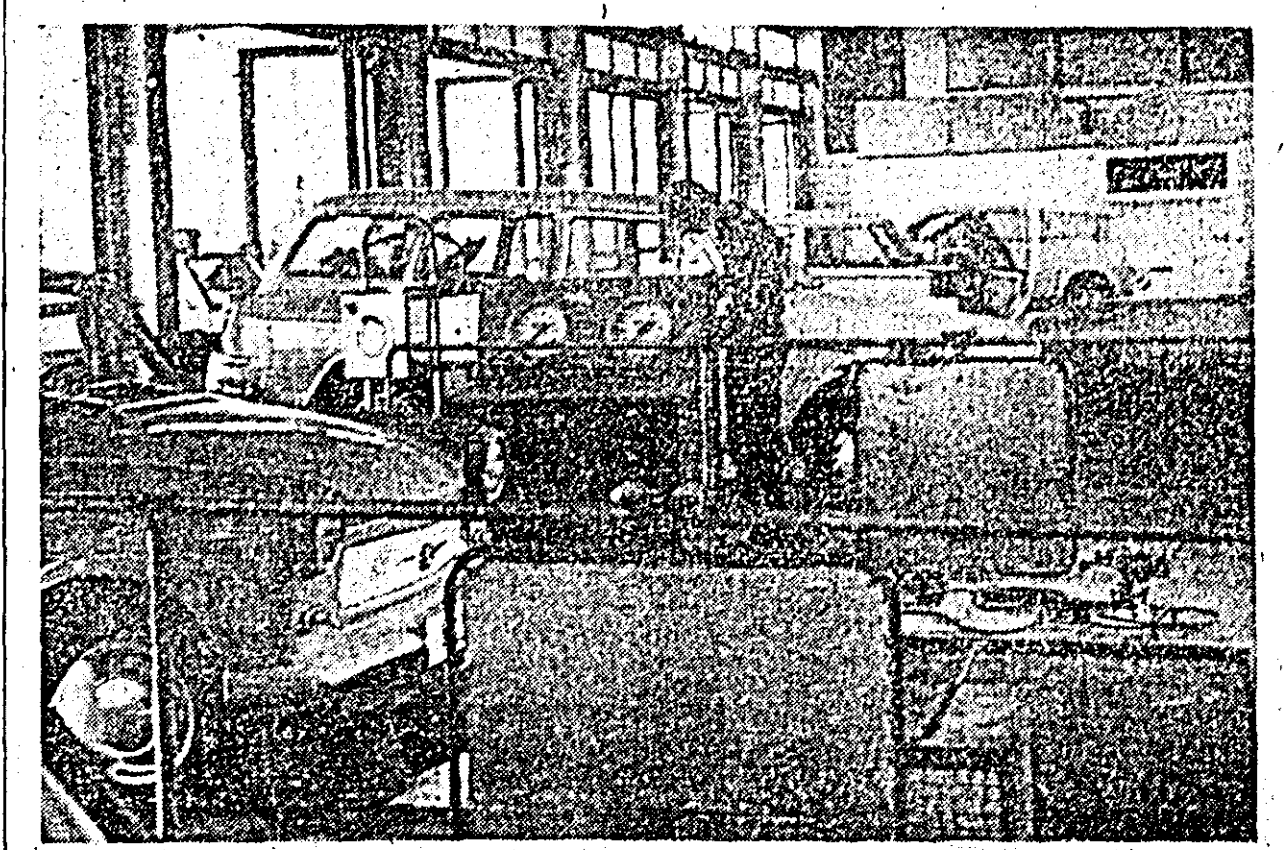
Dotată cu aparate moderne de control și întreținere, secția autoserviciu a cooperativei „Prezicia” se bucură de aprecierea automobilistilor. Depanările, controalele și întreținerea autoturismelor este făcută de specialiști de înaltă clasă. ÎN CLISEU: un aspect din interiorul secției.

Participanții la concurs vor trimite lucrările pînă la 5 august a c. Uniunii Ziariștilor, Calea Victoriei 163, sectorul I, București — cu mențiunea: pentru expoziția „Inscripții la un sfert de veac”. Pentru cele mai bune lucrări, Uniunea Ziariștilor va acorda următoarele premii: premiul I — în valoare de 3.500 lei; premiul II — în valoare de 2.800 lei; premiul III — în valoare de 2.000 lei; 3 mențiuni a câte 1.000 lei, precum și diferite distincții.