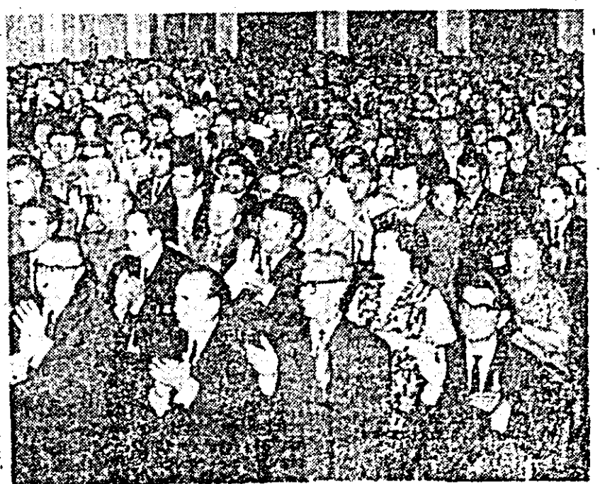
Aspect din timpul conferinței

nizat de mai multe ori pe întreaga suprafață. Acum recoltăm grîul de