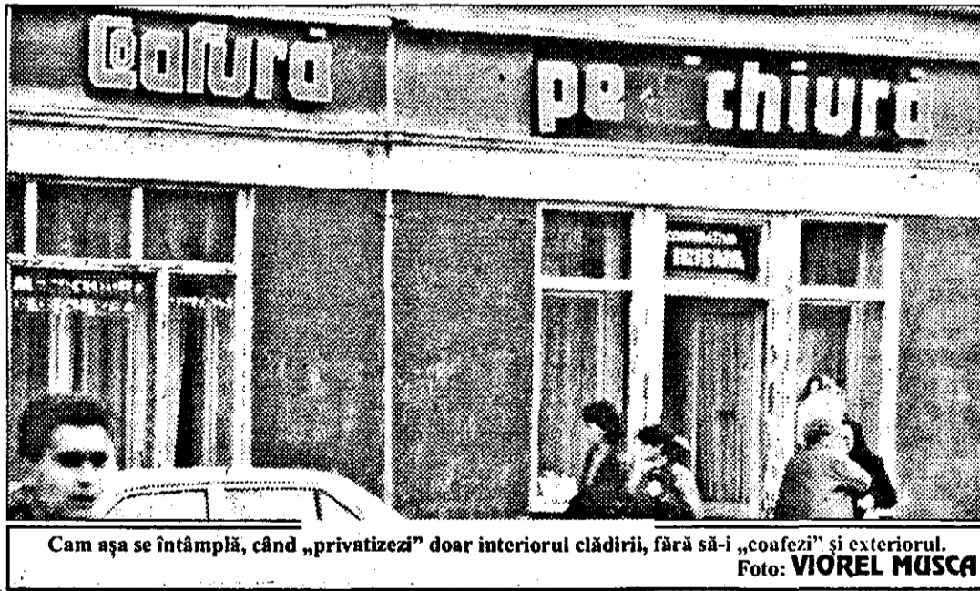
Cam așa se întâmplă, când „privatizezi” doar interiorul clădirii, fără să-i „coafezi” și exteriorul.