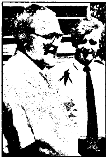
A venit ambasadorul Slovaciei la București, dar au lipsit... țărani.

După cum am anunțat în numărul de ieri al ziarului nostru, 10 iunie a.c., la Gurahont a avut loc o demonstrație de lucru cu motocultorul AGZAT. Organizatorii demonstrației - cunoscuta societate arădeană AZOMA (fosta IMAA), profilată pe producția de utilaje și echipamente agricole și societatea româno-slovacă POSCAROM IMPEX, cu sediul în București - au dorit să facă un test al interesului agricultorilor din zona montană cu suprafețe mici de teren pentru dotarea cu utilaje de mici dimensiuni, fiabile și accesibile ca preț. În acest scop au deplasat în zonă o numeroasă delegație de specialiști în proiectarea, exploatarea și depanarea echipamentului,