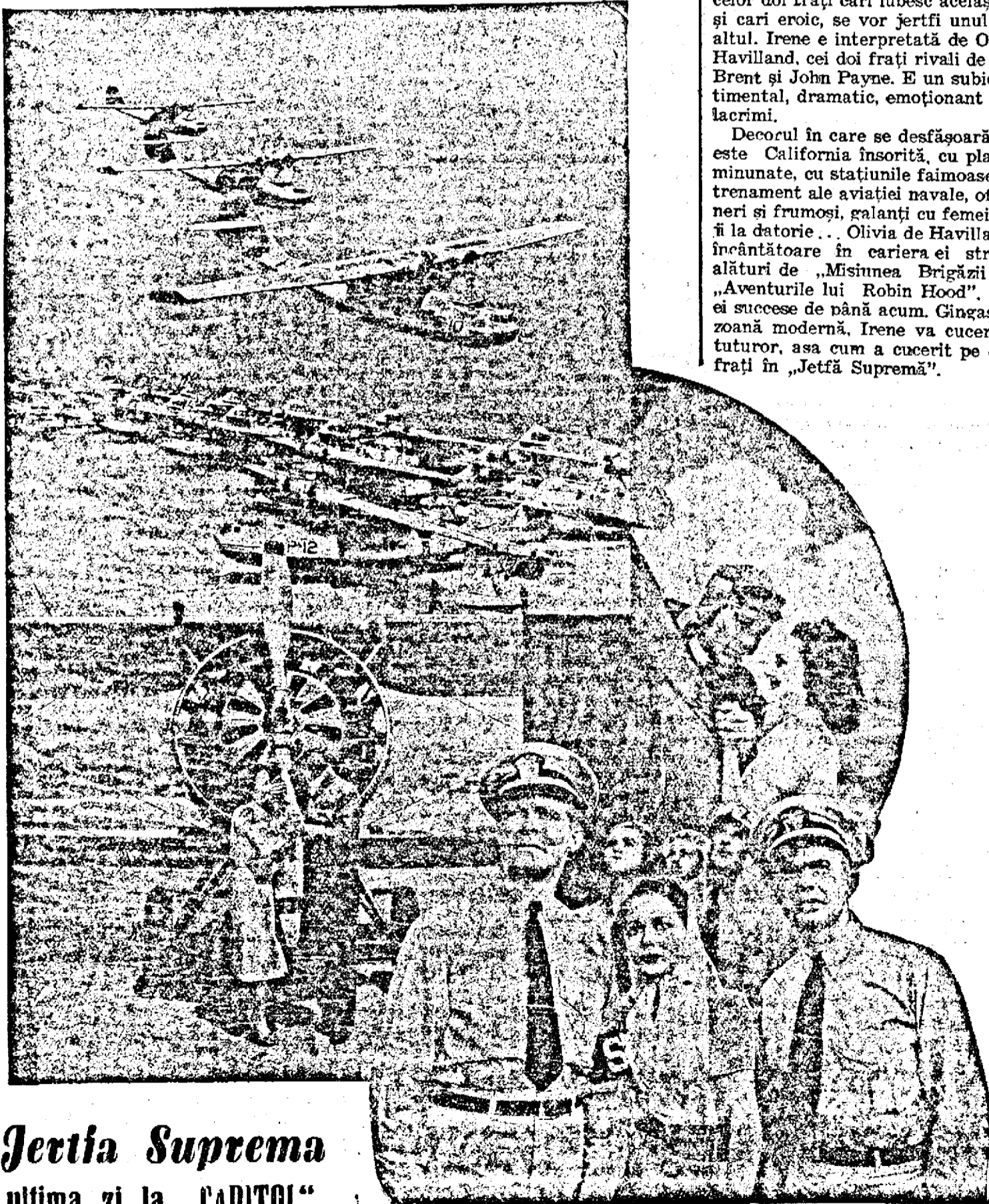
Jertfa Suprema ultima zi la „CAPITOL”

Decorul în care se desfășoară drama este California însorită, cu plajele ei minunate, cu stațiunile faimoase de antrenament ale aviației navale, ofițeri tineri și frumoși, galanți cu femeile, viteji la datorie... Olivia de Havilland este încântătoare în cariera ei strălucită, alături de „Misiunea Brigăzii 41” și „Aventurile lui Robin Hood”. marile ei succese de până acum. Gingașă amazoaană modernă, Irene va cuceri inima tuturor, așa cum a cucerit pe cei doi frați în „Jertfa Supremă”.