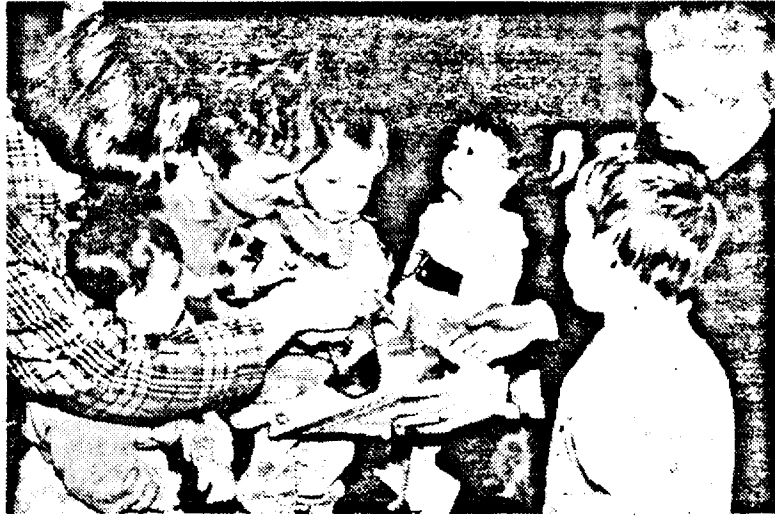
Un dar din dragoste

inițiativă și fără nici un mandat din partea noastră”), premierul României a punctat câteva probleme extrem de interesante: „Nu ne propunem să facem nici o pedeserizare, dar nici nu putem să guvernăm cu manageri pe care electoratul român i-a exclus de pe scena politică. Dacă fostul director al Direcției Agricole reclamă faptul că a fost schimbat pe motive religioase, atunci nu-l credem! Iată că noi, PDSR-ul, am propus în Arad un primar baptist. Nu ne propunem să facem nici o