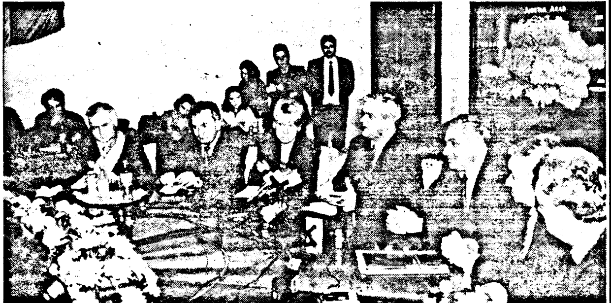
Conferința de presă a premierului Adrian Năstase

DORU SINACI SIMION TODOCA