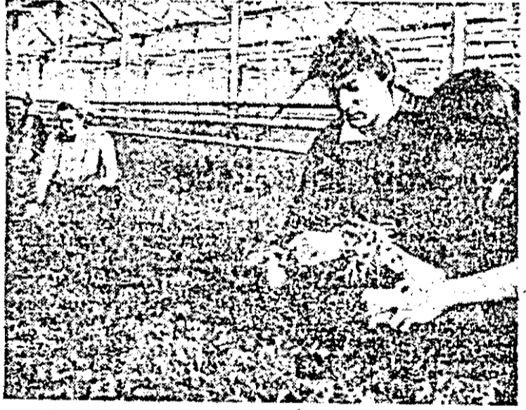
La A.E.C.S. Sere Arad, în aceste zile se acordă o deosebită grijă pregătirii răsădurilor de legume.

Participarea noastră la Festivalul național „Cîntarea României” • Sport: UTA în pragul noului sezon fotbalistic; cronici, rezultate, clasamente • Consultanță juridică • Telegrame externe