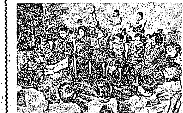
E ora celor mai frumoase povești... (aspect de la grădinița de copii a fabricii „Tricol roșu”).