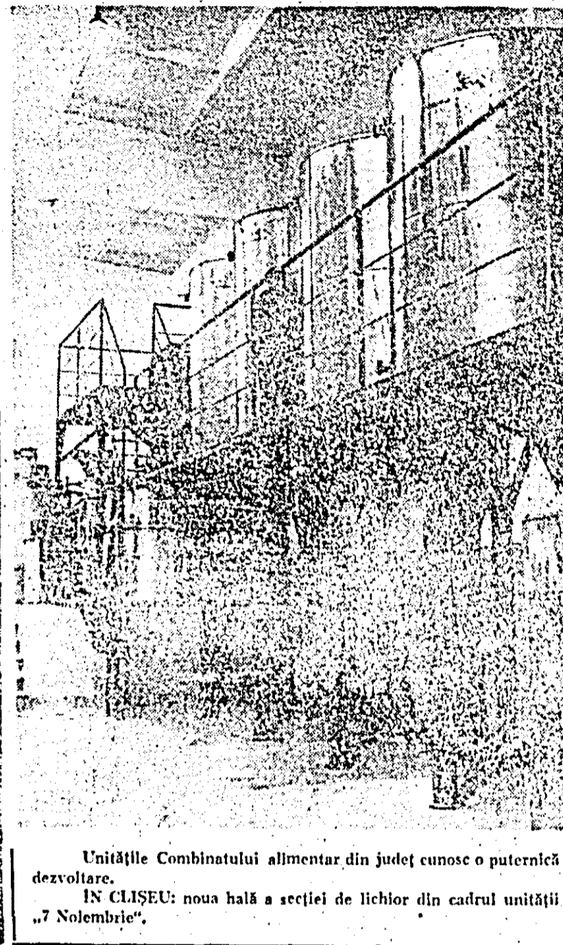
Unitățile Combinatului alimentară din județ cunosc o puternică dezvoltare. IN CLISEU: noua hală a secției de lichior din cadrul unității „7 Noiembrie”.