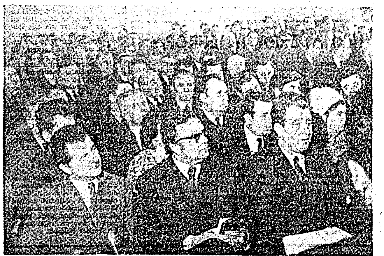
Aspect din timpul lucrărilor conferinței

Sîntem conștienți că avînd la conducere un partid marxist-leninist, Partidul Comunist Român, care și-a doborîdit recunoașterea unanimă a înaltei misiuni datorită politicii sale întemeiate pe realitățile țării, sub îndrumarea organelor și organizațiilor de partid, toți locuitorii din satele și comunele județului Arad — români, maghiari, germani și alți naționalități — nu vor precupeți nici un efort pentru realizarea tuturor sarcinilor care ne revin, contribuind în acest fel la înălțarea României pe drumul socialismului și comunismului, la înflorirea scumpului noastre patrii.