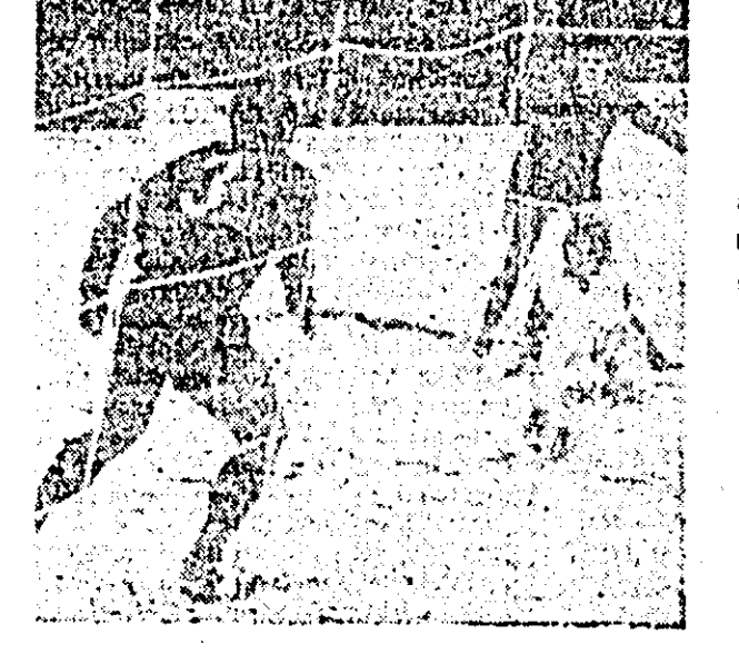
Fată din jocul amical de fotbal UTA — CSM Reșița.

ficative, cunoscute fiind problemele complexe, ce reies din activitatea de gospodărie și utilizare a metalelor, energiei electrice, ale ritmicității producției etc. pe care am fi dorit să le vedem mai substanțial ogîndite în expoziție. O notă bună și standului provenit de la Cenaclul de arte plastice din orașul Ineu. Caricaturile semnate de C. Donici, C. Gîndiș, Al. Sucu sînt expresive și spirituale. Poporul prin sala de expoziție este tonifiant, suscitînd la reflecție; utilitatea satiric, ironie, hazului în acțiunea de perfecționare morală, etică, de conștință a oamenilor fiind evidentă și în actuala expoziție de caricaturi. I. J.