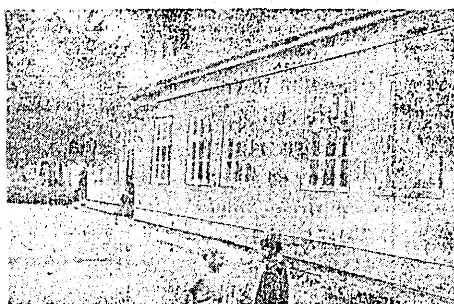
Noua școală din Olari

Dincolo însă de aceste remarcabile realizări culturale considerăm că n-ar strica cu pe viitor să se acorde preocupare pentru ridicarea industrială a acestor meleaguri în sensul înființării unor școli profesionale pentru ca talentele înăscute spre îndeletniciri practice ale multor tineri să aibă pe plan local, largi posibilități de afirmare.