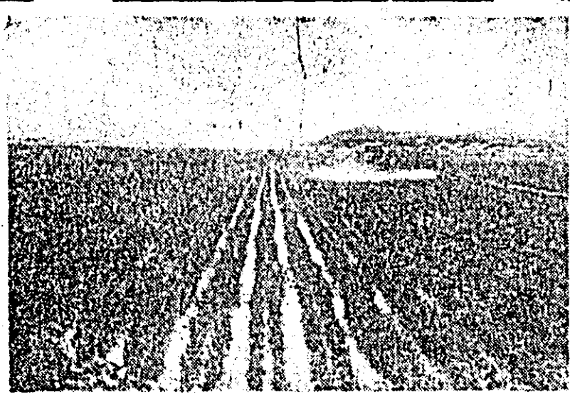
R. P. D. COREEANA. IN FOTO: Stropirea culturilor de orez cu soluții împotriva dăunătorilor la cooperativa agricolă de la Cholima Ryongșan, regiunea Caepung.

că actuala vizită va contribui la extinderea cooperării și la dezvoltarea bunelor legături dintre cele două țări.