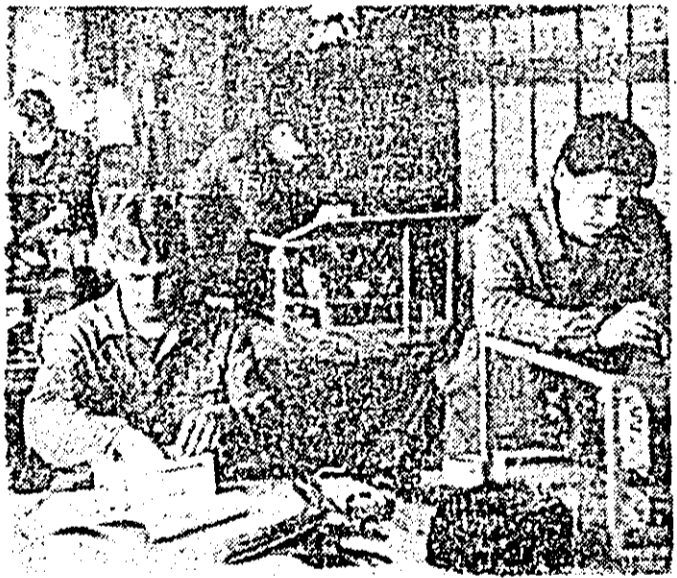
Întreprinderea de vagoane Arad. Aspect de muncă în atelierul tablourilor electrice pentru metrou.

această privință este și faptul că în primele patru luni ale anului, colectivul compartimentului creație a realizat 9 articole noi de țesături, cu 140 desene și 560 pozizii coloristice — și aceste noi articole de țesături asigurînd o valorificare superioară a materialelor prime.