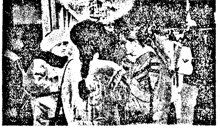
Semne de primăvară?!