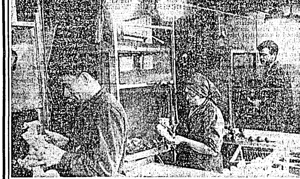
La I.I.S. „Ardeanca” din orașul nostru se produc multe modele de păpuși, apreciate pentru calitatea și frumusețea lor.

Cele aflate în discuție purtate ne duc la concluzia că uzina a luat din timp măsurile necesare pentru ca producția anului 1967 să se poată desfășura ritmic din primele zile. Și în ce privește cadrele care vor organiza și realiza producția situația e mai bună. În ultimul timp uzinei i-au fost repartizați 16 tineri ingineri, s-au întors 20 de maiștri bine pregătiți care au urmat școlile speciale, la care se adăugă sutele de muncitori care și-au desăvîrșit cunoștințele profesionale prin cursuri de calificare și specializare, organizate în uzină, diferențiat, pe profesii și nivele de calificare.