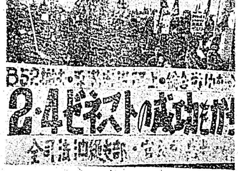
JAPONIA. Aspecte de la recentele demonstrații desfășurate la Naha, Okinawa, împotriva existenței pe teritoriul insulei a bombardierelor gigantice B-52, a portavioanelor americane cu încălzitură nucleară, pentru abrogarea tratatului de securitate americano-japonez.

Din fericire, pompierii au sosit tocmai la timp pentru a preveni declanșarea unui mare incendiu.