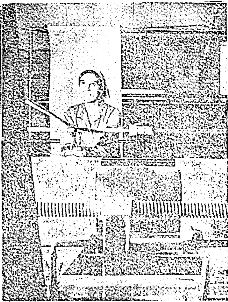
Uzinele textile „30 Decembrie”. Supraveghind modernele mașini de albit.