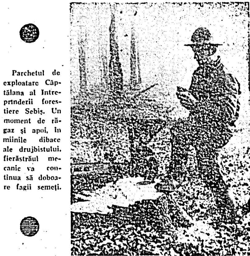
Parcelatul de exploatare Căpătăna al întreprinderii forestiere Sebis. Un moment de răgaz și apoi, în mințile dibace ale drujbistului, fierăstrăul mecanic va continua să doboare fașii semeți.