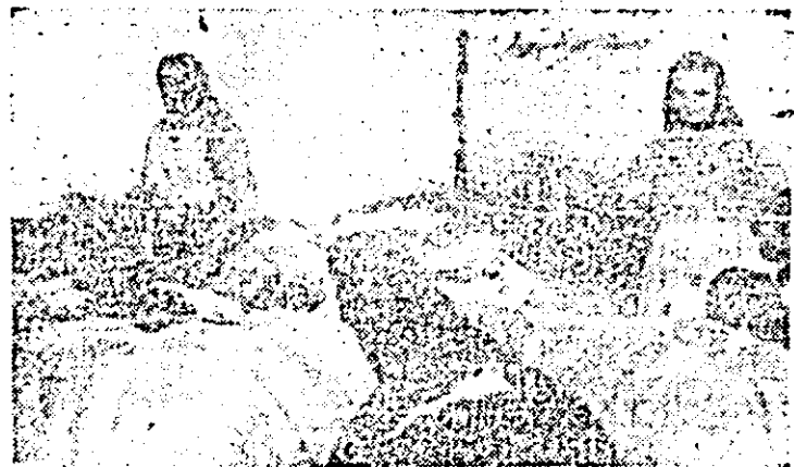
La C.A.P. „23 August” Curtici se acordă o atenție deosebită creșterii tineretului bovin.