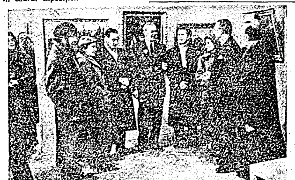
ÎN CLIȘEU: maestrul Aurel Ciupe, artist emerit al R.P.R. în mijlocul artiștilor plastici arădeni.