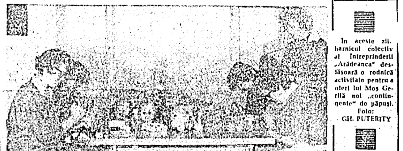
În aceste zil- harnicul colectiv al întreprinderii „Ardeanca” des- fășoară o rodnică activitate pentru a oferi lui Mos Ge- nărlu noi „confin- gențe” de păpuși.

culescu-Mizil, membru al Comite- tului Executiv, al Prezidiului Per- manent, secretar al CC al PCR. Întîlnirea s-a desfășurat într-o atmosferă caldă, tovarășească.