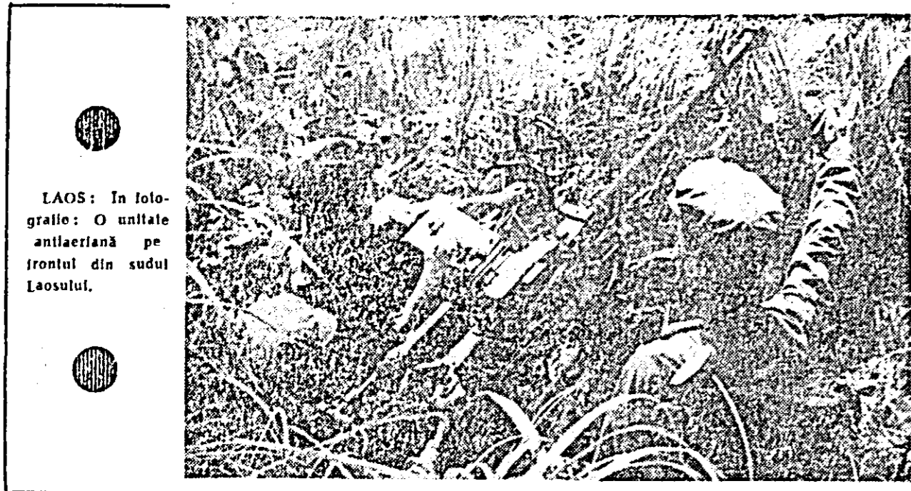
LAOS: In fotografie: O unitate antiaeriană pe frontul din sudul Laosului.