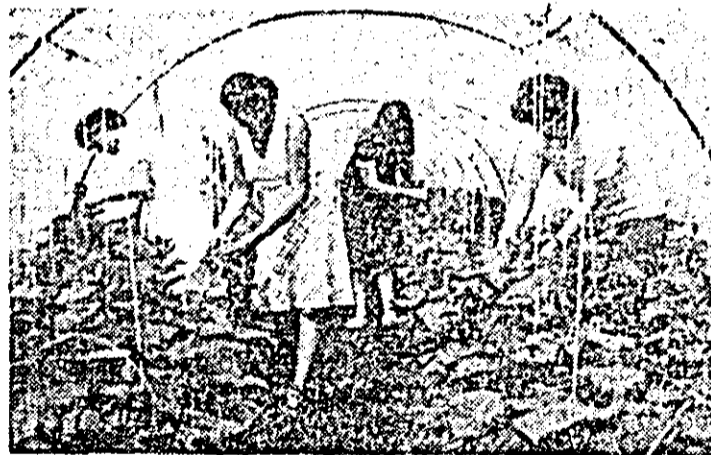
Muncă atentă, grijă și responsabilitate, la Stațiunea de producție și cercetare legumicolă Aradul Nou.