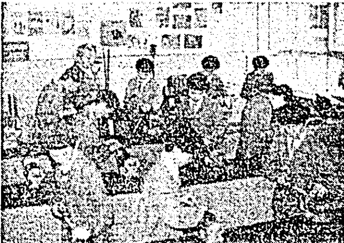
Aspect din timpul concursului între pionierii claselor a VII-a.