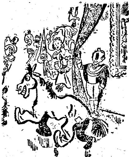
Hölgyem és Uram! A házigazda és Neje ömeltósága...