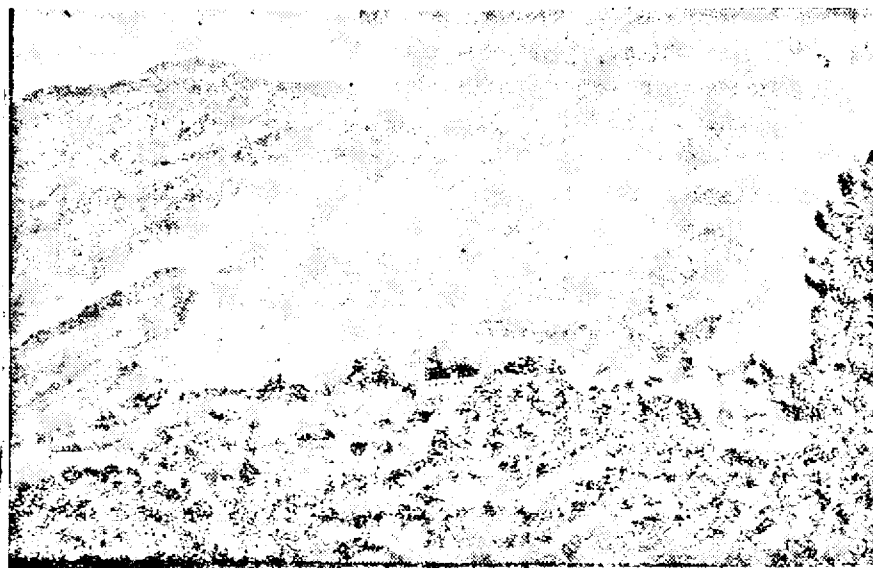
Clișeele noastre arată : Sus: Minunatul cartier de vile Mill Valley. Jos: Mill Valley în timpul incendiului.